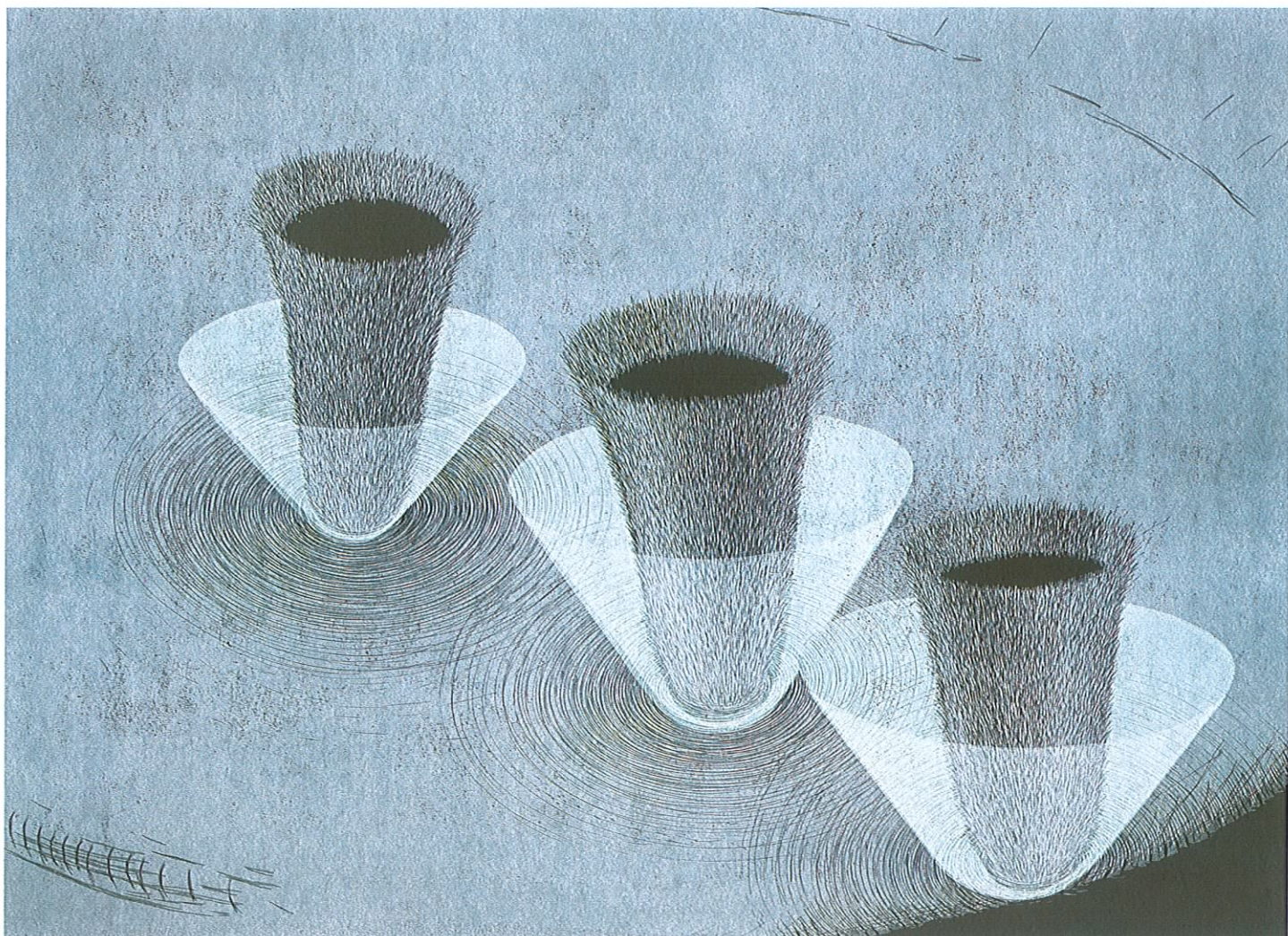
Spravedlivé dělení, 1999, linoryt, 59 x 83 cm